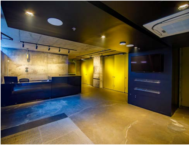
L'entrée du théâtre